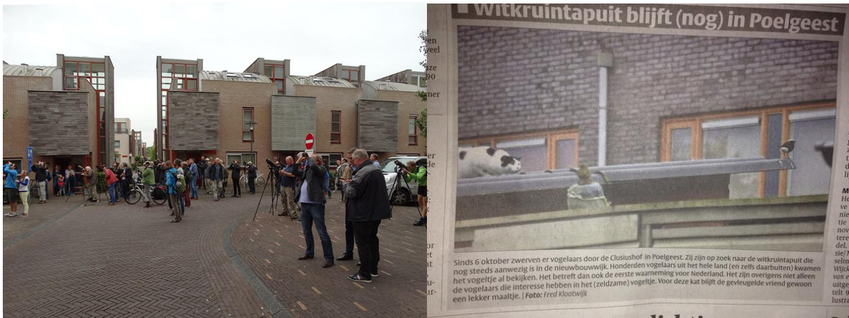
Calimero zet de wijk op zn kop.

De afgelopen maanden hebben we gehad een geslaagde kerstmarkt , een mooie knotactie (zie het voorgaande artikel) en de Superr op de tv in Koffietijd ( http://www.koffietijd.nl/uitzendingen/superr/ ). De Witkruintapuit heeft het vermoedelijk, en helaas, moeten afleggen tegen een kat. Het pad door de polder naar Warmond is operationeel, al is het nog wel een beetje plas-dras, maar het is nu mogelijk een mooie groene doorsteek te maken richting de Kagerplassen. Tenslotte hebben de gezamenlijke colleges van Leiden en Oegstgeest de plannen voor een ontsluitingsbrug aan het einde van de Hugo de Vrieslaan verworpen. Een tweede ontsluiting van Poelgeest staat “absoluut niet ter discussie” aldus wethouder Tönjann, maar hoe die er uit zal zien is vooralsnog een raadsel. En hoe wij onze wijk in- en uit zullen komen als het verkrumelende asfalt op de huidige brug moet worden vervangen evenzeer.